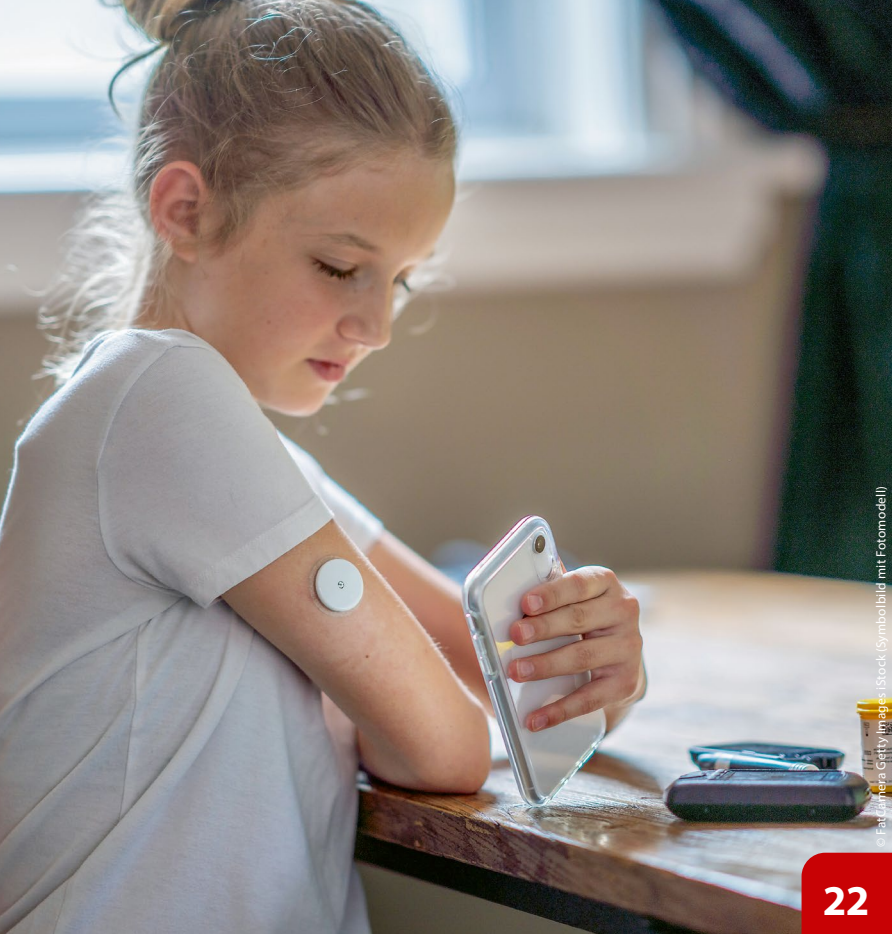
(Stock Symbolbild mit Fotomodell)