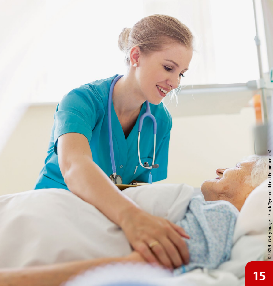
(Symbolbild mit Fotomodellen)