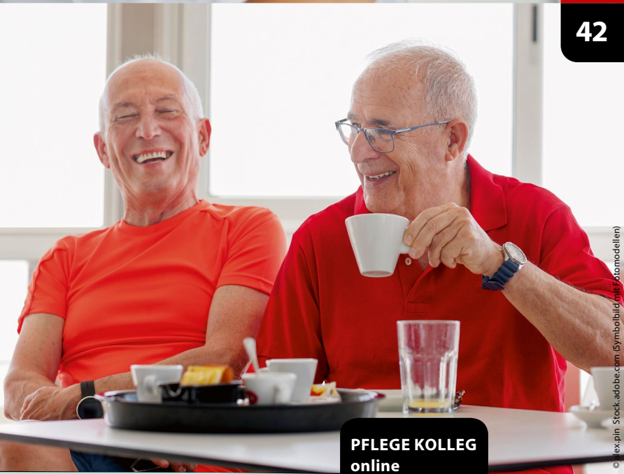
(Symbolbild mit Fotomodellen)