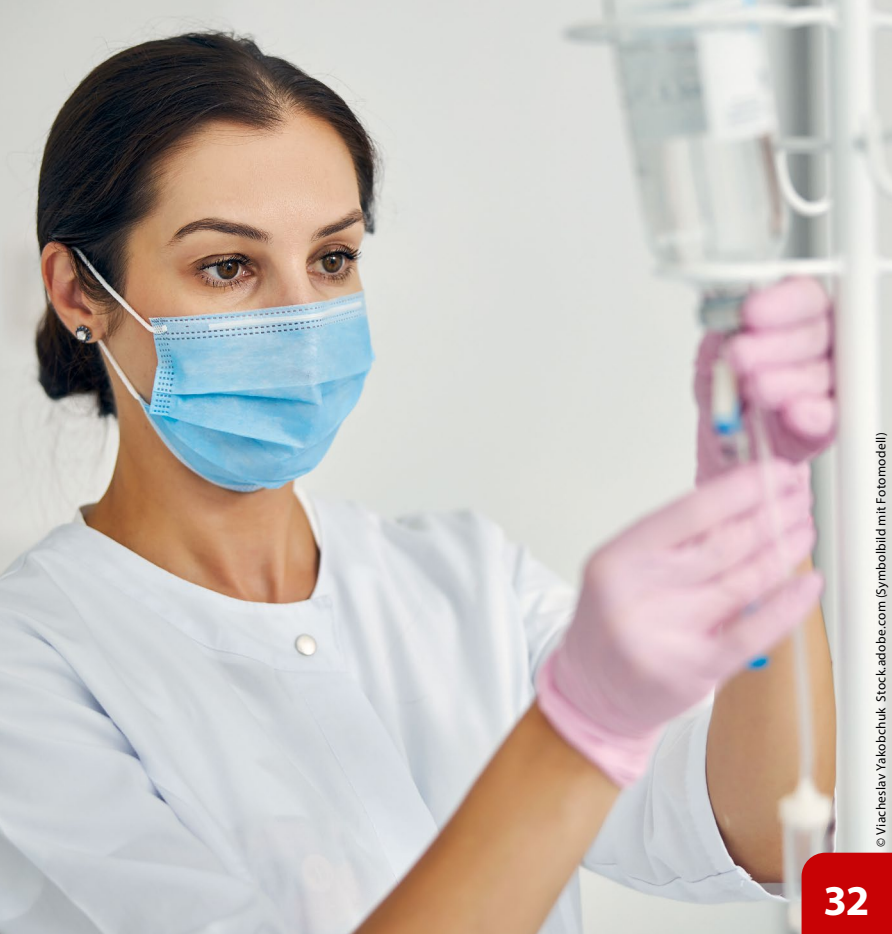
© Vacheslav Yakobchuk - Stock.adobe.com (Symbolbild mit Fotomodell)