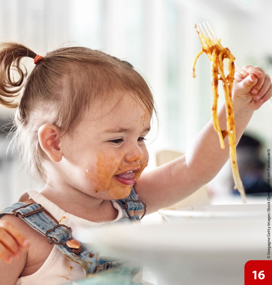
© | Islegagne Getty Images | iStock (Symmetrie) mit Fotomodel |