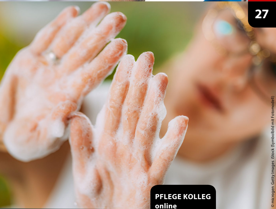
(Symbolbild mit Fotomodell)