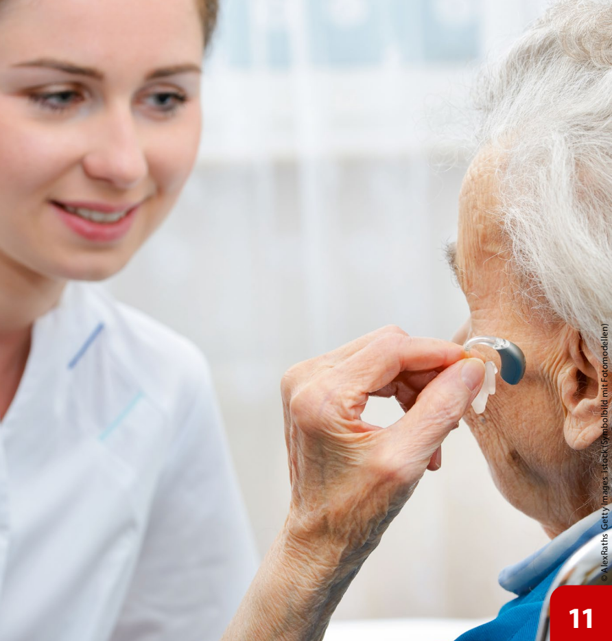
(Symbolbild mit Fotomodellen)