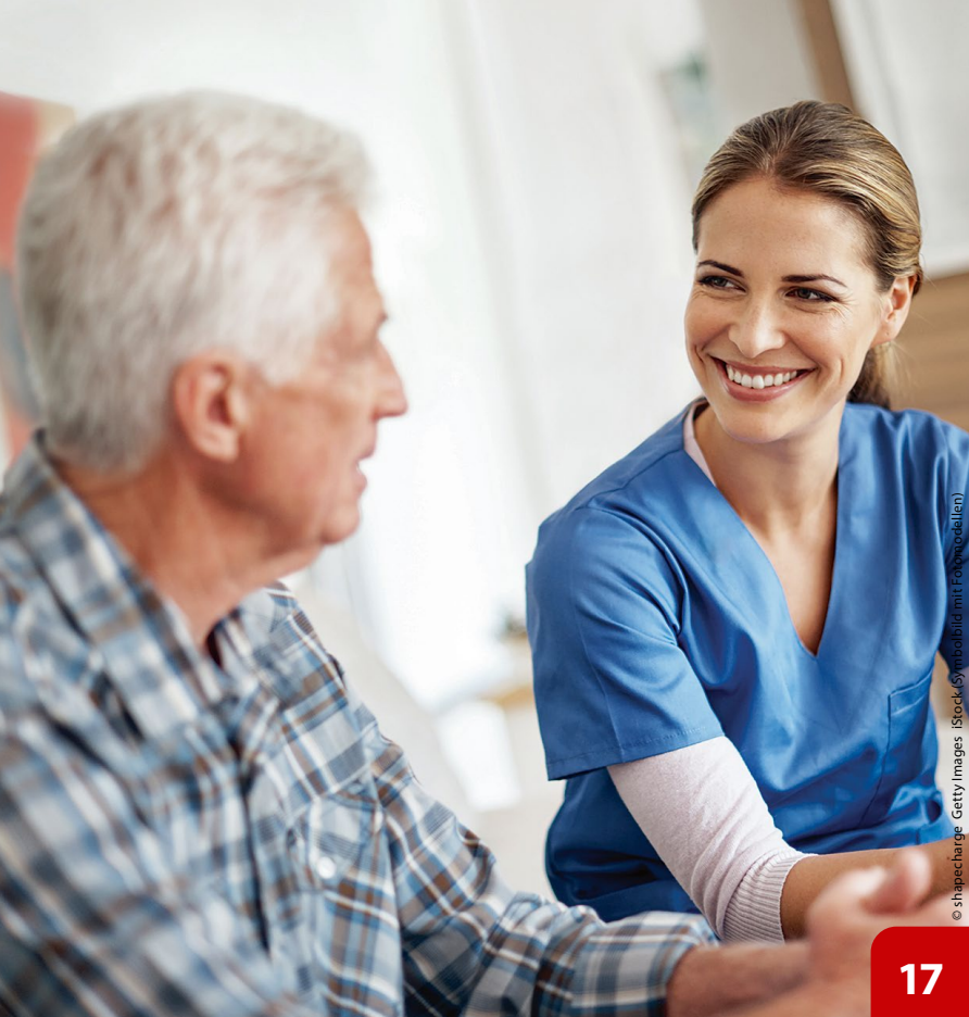
(Stock-Symbolbild mit Fotomodellen)