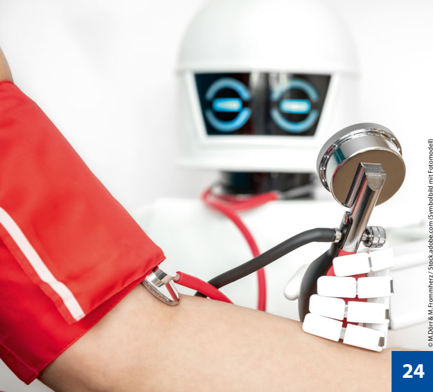
(Symbolbild mit Fotomodell)