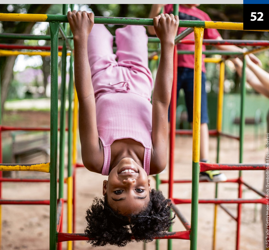
(Symbolbild mit Fotomodellen)