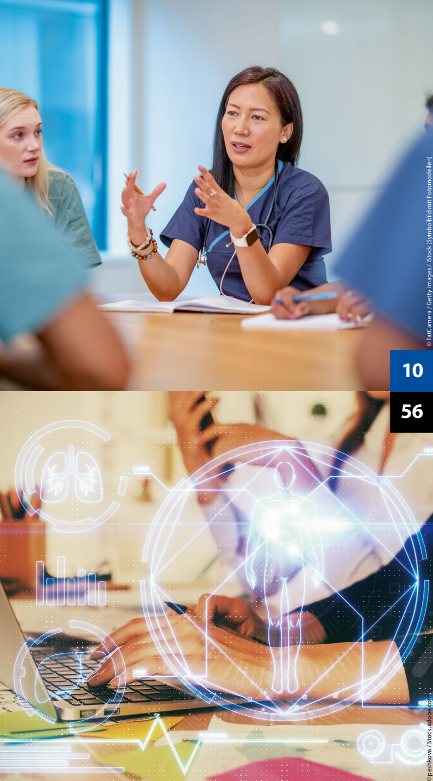
(Symbolbild mit Fotomodellen)