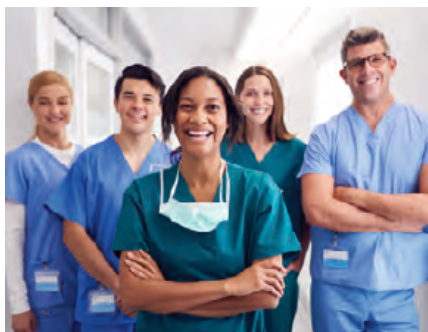
Photo: © monkeybusinessimages / Getty Images / iStock (Symbolbild mit Modellen)