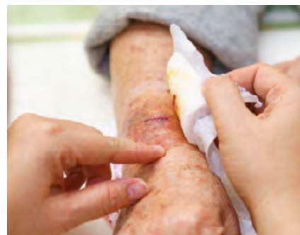
(Symbolbild mit Modellen)

Die Merkmale einer Therapie mit Immuncheckpointinhibitoren unterscheiden sich deutlich von denen einer klassischen zytotoxischen Therapie.